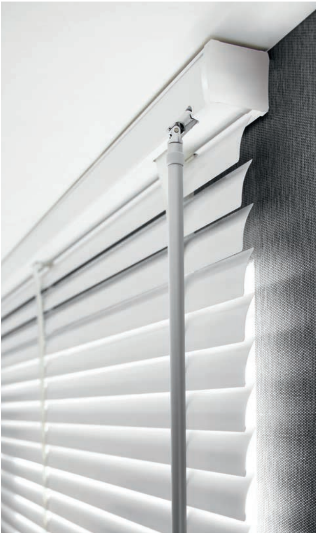
Kurbel: Bedienung des Behangs und Wendung der Lamellen erfolgt durch eine ästhetische Kurbel aus Aluminium.