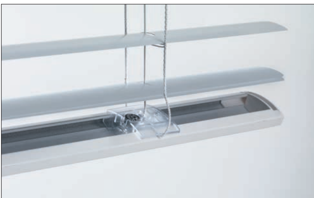
Feinjustierung der horizontalen Ausrichtung der Unterschiene mittels einer in ihr integrierten und von der Abschlusslamelle verdeckten Justier Vorrichtung.