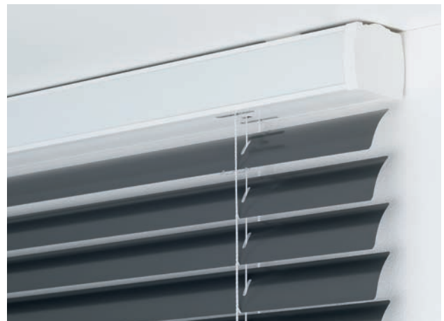
Elektro-Antrieb: Bedienung des Behangs und Wendung der Lamellen erfolgt bequem durch verschiedene Steuerungs- und Funksysteme (Elektro-Antrieb 230 V).