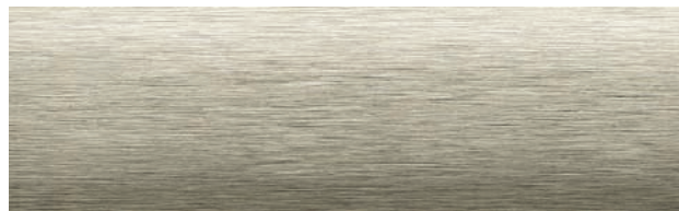
2-546 BRUSH, Lamellenbreite 50 mm, R: 64%