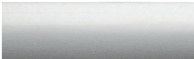
1-512 SWIFT, Lamellenbreite 50 mm, R: 48%