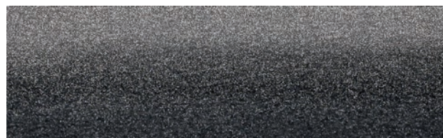
2-616 POMP, Lamellenbreite 50 mm, R: 19%