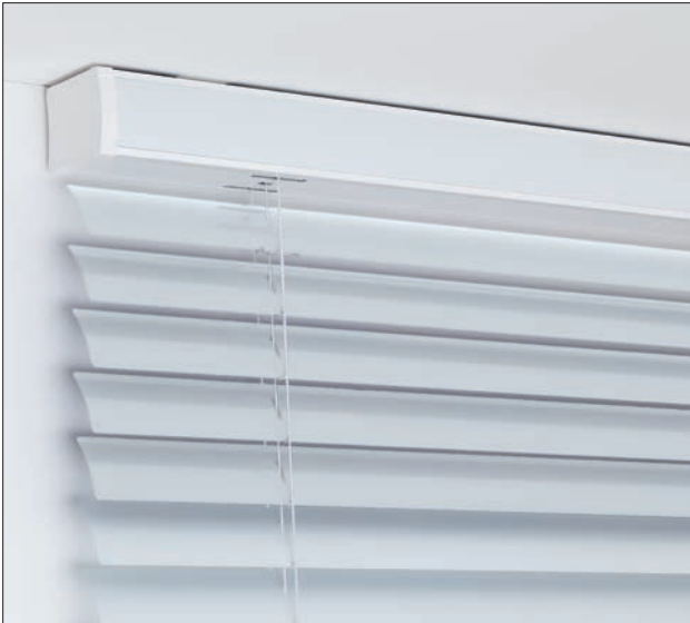
Fast unsichtbare Schattenfuge des Alu-Kopfprofils bei Deckenmontage. Zusätzlich harmonische Gesamterscheinung durch farblich an den Behang angepasste Einschublamelle.

ckenmontage, die jetzt mit einer fast unsichtbaren Schattenfuge möglich ist. Das ästhetische, stranggepresste Alu-Kopfprofil ist besonders formstabil und fügt sich zudem hervorragend in die großformatige Optik des Produktes ein. Zusätzlich kann die horizontale Ausrichtung der Unterschiene auch nach der Montage noch mittels einer durch die Abschlusslamelle verdeckten Vorrichtung feinjustiert werden.