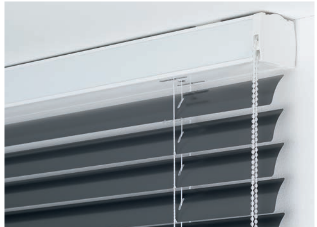
Kette: Bedienung des Behangs und Wendung der Lamellen erfolgt durch eine transparente Kette.