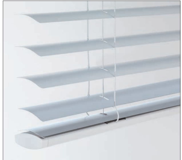
Harmonische Gesamterscheinung des Produkts durch farblich an den Behang angepasste Abdecklamelle auf der Unterleiste.